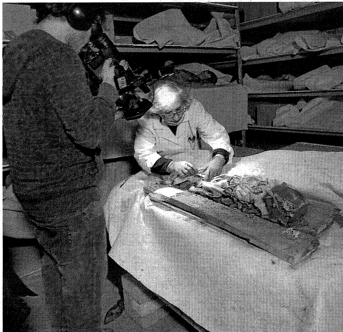
Una experta en momiología examina uno de los cuerpos delante de la cámara de televisión. L. PÉREZ

Este conjunto de enterramientos tiene interés por haber sufrido un peculiar fenómeno de momificación natural. La DGA lleva tres años sin resolver su destino. Esta semana una arqueóloga del Gobierno aragonés y una restauradora recabaron datos sobre el terreno. Heraldo