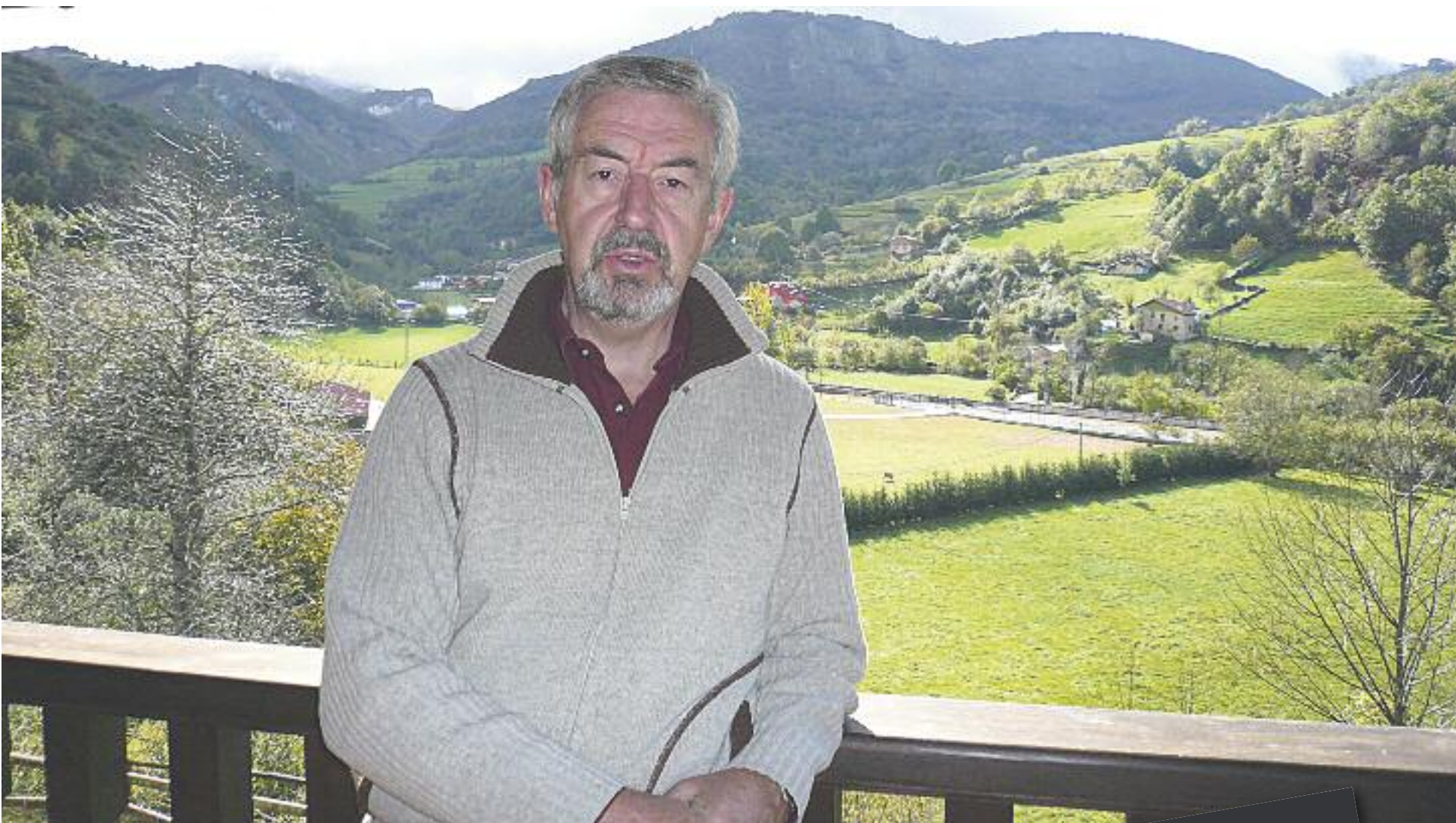
El escritor riojano de nacimiento y turolense de adopción, durante un viaje reciente a Asturias